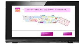
システムデバイスタイプ