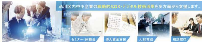
品川区内外中小企業の戦略的なDX・デジタル技術活用を多方面から支援します。