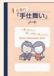
仕事の手仕舞いノート

心の中を書き出してみることで頭が整理され、事業承継の一步を踏み出す勇気が湧いてきます。