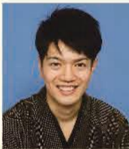
瀧川あまく鯉(あまくり)