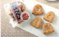
平成29年度認定品 王将監焼(ミニサイズ)

※「しながわみやげ」とは産業の活性化を図るため、観光という視点で、2つの部門(食品部門・非食品部門)を設け、区が認定したものです。過去の認定品は、しながわ観光協会ホームページもしくは中小企業センター1階観光PRコーナー等にて配布しているパンフレットをご覧ください。